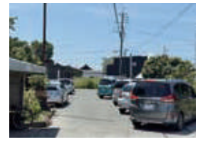
駐車場 更に広くなりました 30台駐車可

※囲碁・将棋・健康マージャンは平日午後利用可・要確認 ※毎月発行の「センター行事予定表」をご覧ください