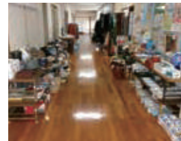
リサイクルバザー