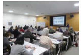
昨年の主催講座の様子