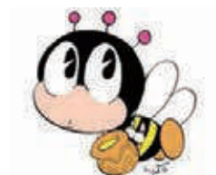
生涯学習マスコット「マナビ」